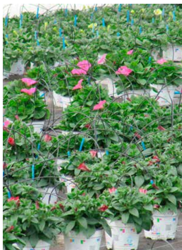
Petunie dovunque: sembra davvero di entrare in un altro mondo.